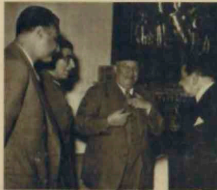
عبد الناصر ونجيب والسهوري وعلي ماهر أعمدة موقعة الدستور سنة ١٩٥٤

فكيف كان يمكن أن تكون حال مصر، وحال الوطن العربي كله، لو أن هذا الحلم كان قد وضع موضع التطبيق خلال النصف الثاني من القرن العشرين، فتأسست طبقا له جمهوريات برلمانية أو ملكيات دستورية؟ هل كان سيقودنا إلى الوقوع بين مطرقة الاستبداد وسندان الإغواء كما قادنا الطريق البديل؟ وحتى لا يضيع الحلم مرة أخرى ، فقد جاء الوقت لنشر النص الكامل لمواد مشروع دستور ١٩٥٤، الذي عثرنا عليه في صندوق القمامة، لعله يجد رأيا عاما يناقشه، ويتخذ منه راية للمطالبة بإصلاح النظام السياسي العربي، إصلاحا جذريا، حتى لا يظل على ما هو عليه فيقودنا إلى محاق التاريخ.